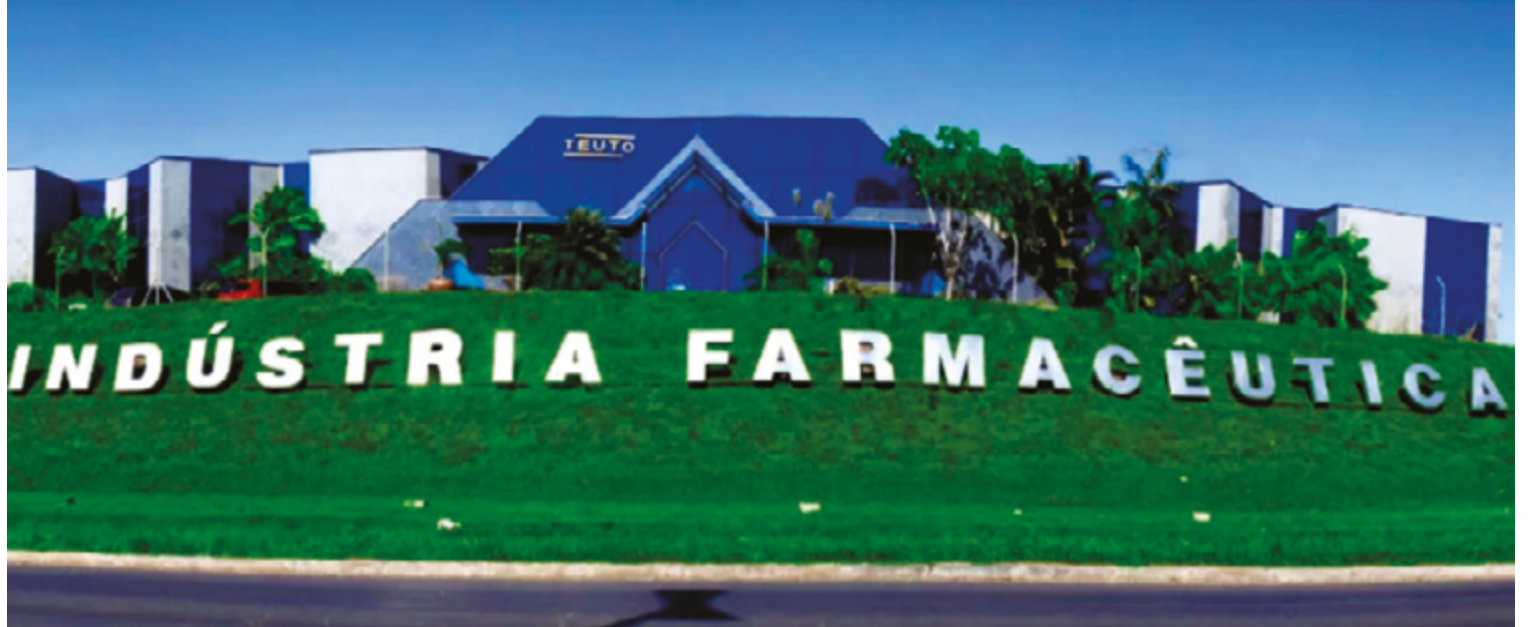
Em um marco significativo para a saúde e economia do município, condição mostra a relevância da indústria farmacêutica local

vestimento de R$ 40 milhões, a ampliação deste espaço não apenas incentiva o crescimento das empresas já estabelecidas na cidade, mas também atrai novos investidores, consolidando Anápolis como um polo estratégico para o setor.