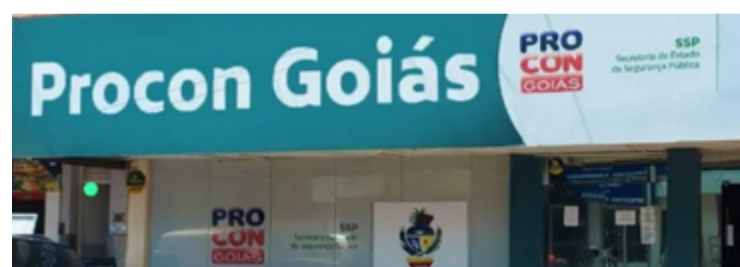
Mudança visa desburocratizar serviços e tornar acesso mais simples para a população