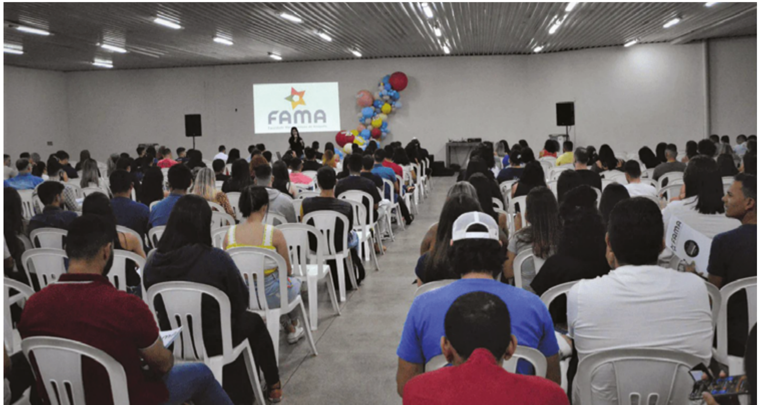
O acolhimento e o apoio, em ambiente amigável, são diferenciais na hora de escolher uma faculdade; essas são características da FAMA

A boa escolha de uma faculdade que ofereça preparação completa para o mercado de trabalho, é importante observar a qualidade e a variedade de cursos na área de humanas, saúde, exatas e da terra e se esses cursos têm qualidade