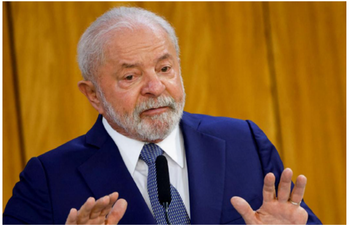
Lula da Silva: otimista com as pesquisas eleitorais em Goiânia e Campo Grande

O partido do presidente Lula está lançando candidatos em cinco das nove capitais da região, quatro deles com chances reais de chegar ao segundo turno. Teresina, Fortaleza, Natal e João Pessoa vão receber atenção especial da legenda, cidades onde os petistas aparecem bem colocados nas pes-