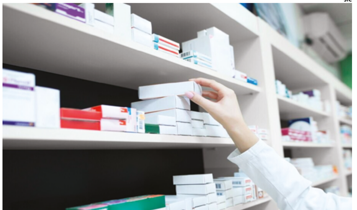
O setor de produção de medicamentos em Anápolis evoluiu nas últimas décadas e, ainda, continua em expansão

"O polo farmacêutico de Anápolis, um dos principais do Brasil e da América Latina, tem contribuído significativamente para quebrarmos o recorde na geração de empregos. Nos últi-