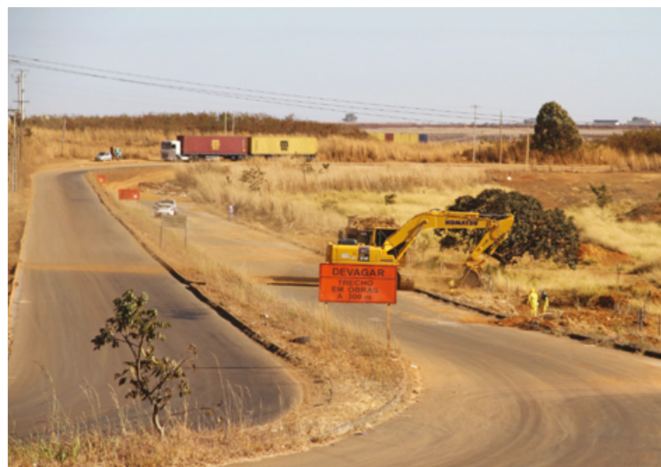
Máquinas da Goinfra, há alguns dias, já realiza trabalhos de limpeza da extensão da via e faz etapa de mobilização