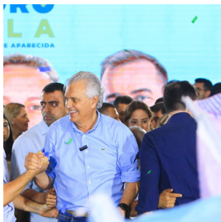
Americanos expressam preocupação com recentes acontecimentos: declaração conjunta com G7

A situação atual destaca a importância da cooperação internacional e do diálogo contínuo entre as nações. Os países do G7 continuam a defender a necessidade de soluções pacíficas e diplomáticas para os problemas globais. A comunidade internacional está sendo chamada a unir esforços para enfrentar os desafios e garantir um futuro mais seguro e estável para todos.