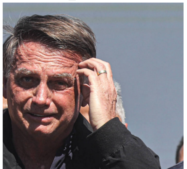
Jair Bolsonaro: PL não faz alianças eleitorais com os partidos de esquerda

Bolsonaro ainda alertou que ele deve apoiar candidaturas adversárias em municípios onde não for possível desfazer as coligações entre o PL e legendas de esquerda. “Já está definindo que nós estamos, além de desfazendo isso aí onde foi feito, você eleitor fica ligado, onde não for possível desfazer, nós vamos fazer campanha para o outro lado. Ver um bom candidato de outro partido e fazer campanha nesse sentido”, alertou.