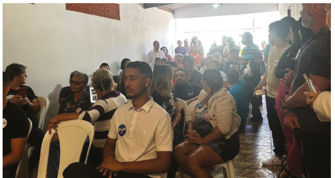
Convenção do PSD foi realizada na sede do partido, no Bairro Jundiá; membros do PL não estiveram na reunião