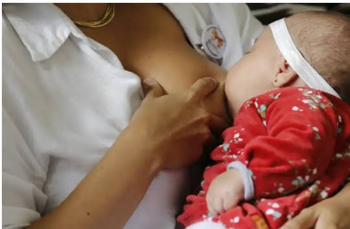
Alimento é disponibilizado pelo Banco de Leite Humano: ações celebram campanha Agosto Dourado

Só no ano passado, o BLH coletou 1.423 litros de leite, beneficiando 1.529 recém-nascidos. Todos os meses a unidade recebe em média 150 litros de leite de doadoras e distribui para, aproximadamente, 200 crianças. O BLH conta com o apoio do Corpo de Bombeiros Militar do Estado de Goiás para coletar o material na casa das doadoras. As mães precisam seguir algumas exigências para realizar a doação, como apresentar exame de pré-natal que comprove ausência de doenças infectocontagiosas, não podem ser fumantes, usu-